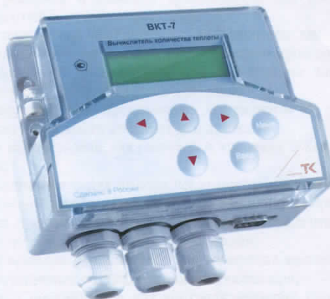
Рисунок 1 – Внешний вид вычислителя

Внешний вид вычислителя приведен на рисунке 1.